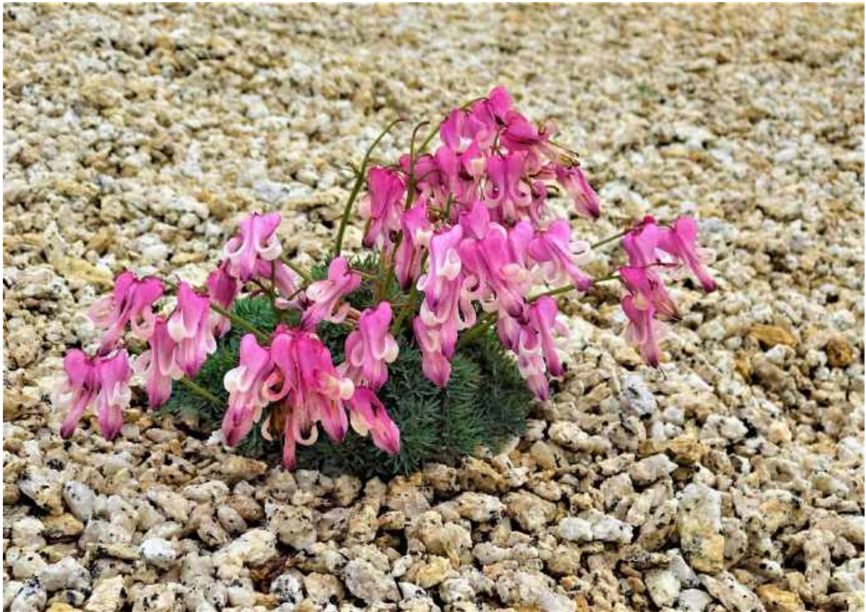
『コマクサ：表銀座にて』