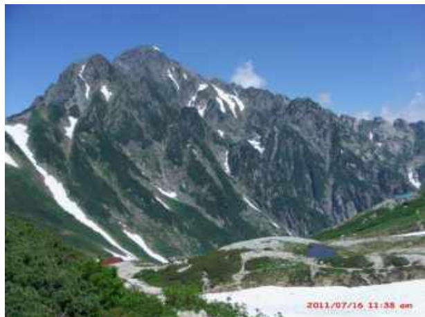
北アルプス・剣岳