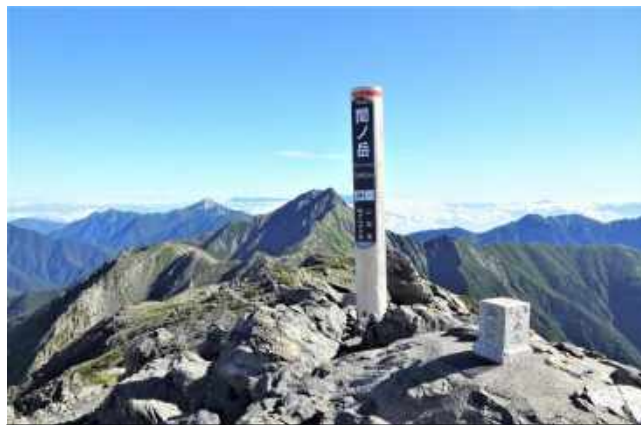
間ノ岳 2018.7.31